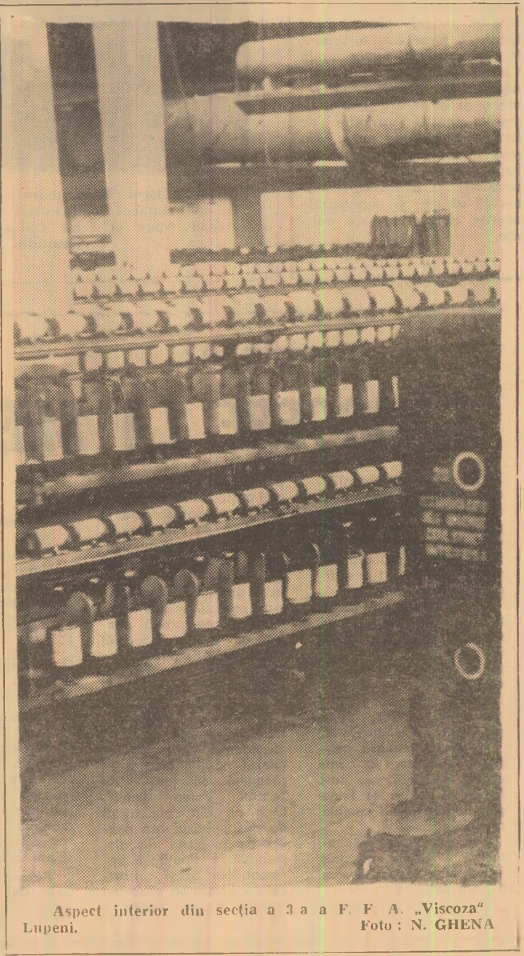
Aspect interior din secția a 3 a a F. F. A. „Viscoza” Lupeni.