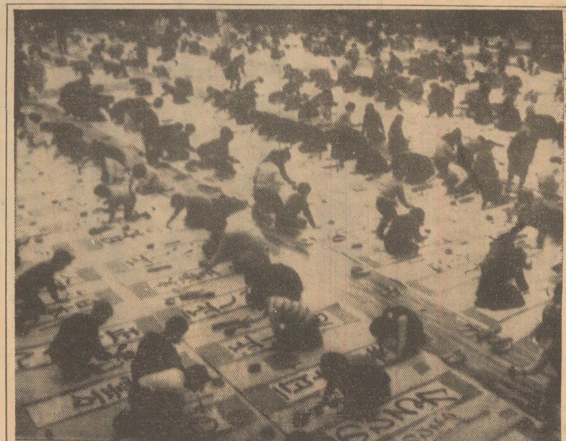
JAPONIA: La începutul lunii februarie s-a desfășurat la Nihon Budokan Hall din Tokyo tradiționalul concurs de scriere caligrafică, la care au participat peste 2.500 de persoane, femei, bărbați, tineri și bătrâni.

pică pentru încheierea păcii”. „Dacă guvernul israelului, a dauga comunicatului, nu dă curs prevederilor rezoluției Consiliului de Securitate din noiembrie 1967, cu și planului Rogers și propunerilor lui Jarring, el va pune în pericol înstaurarea acestei păci și, prin urmare, guvernul iranian va condamna atitudinea sa”. Sauținând „reacția pozitivă a R.A.U. la memorandumul lui Jarring”, guvernul iranian și-a exprimat speranța că Israelul va face, la rândul său, „un pas pozitiv în direcția păcii și stabilizării în regiune”.