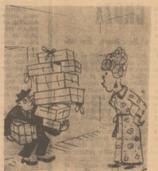
— Parcă anul trecut, de ziua mea n-ai fost așa de... zgîrcit!...