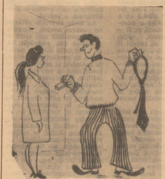
— Uite, de ziua ta, ți-am lăsat o ciocolată și mie o cravată să leșim deseară împreună...