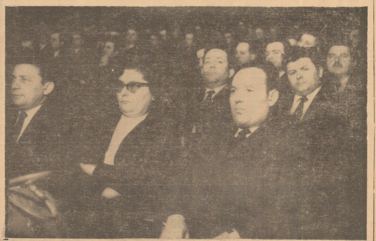
Aspect din timpul lucrărilor conferinței

Ieri, la Petroșani, în frumoasa sală a Casei de cultură a sindicatelor, a avut loc Conferința Uniunii sindicatelor din ramura minieră și energiei electrice. Desfășurată în contextul largilor dezbateri prilejuate de elaborarea Tezilor Consiliului Central al U.G.S.R. pentru Congresul Uniunii Generale a Sindicatelor din România, în lumina indicațiilor Plenarei C.C. al P.C.R. din 10-11 februarie a. c., conferința a reunit sute de delegați ai sindicatelor care au reprezentat colectivele de salariați din întreprinderile miniere, de explorări geologice, ale șantierei hidroelectrice și unităților producătoare de energie electrică.