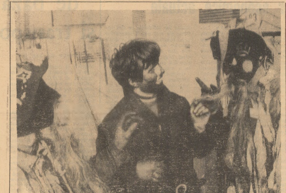
In satul Miha există un vechi obicei, ca în ultima zi a sezonului de carnaval, flăcăii din sat să se îmbrace în haine zdrențuite și mascați, să colinde satul, murdărind fețele sătenilor. In foto: O „victimă” a vechiului obicei.