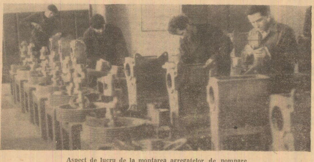
Aspect de lucru de la montarea agregatelor de pompă