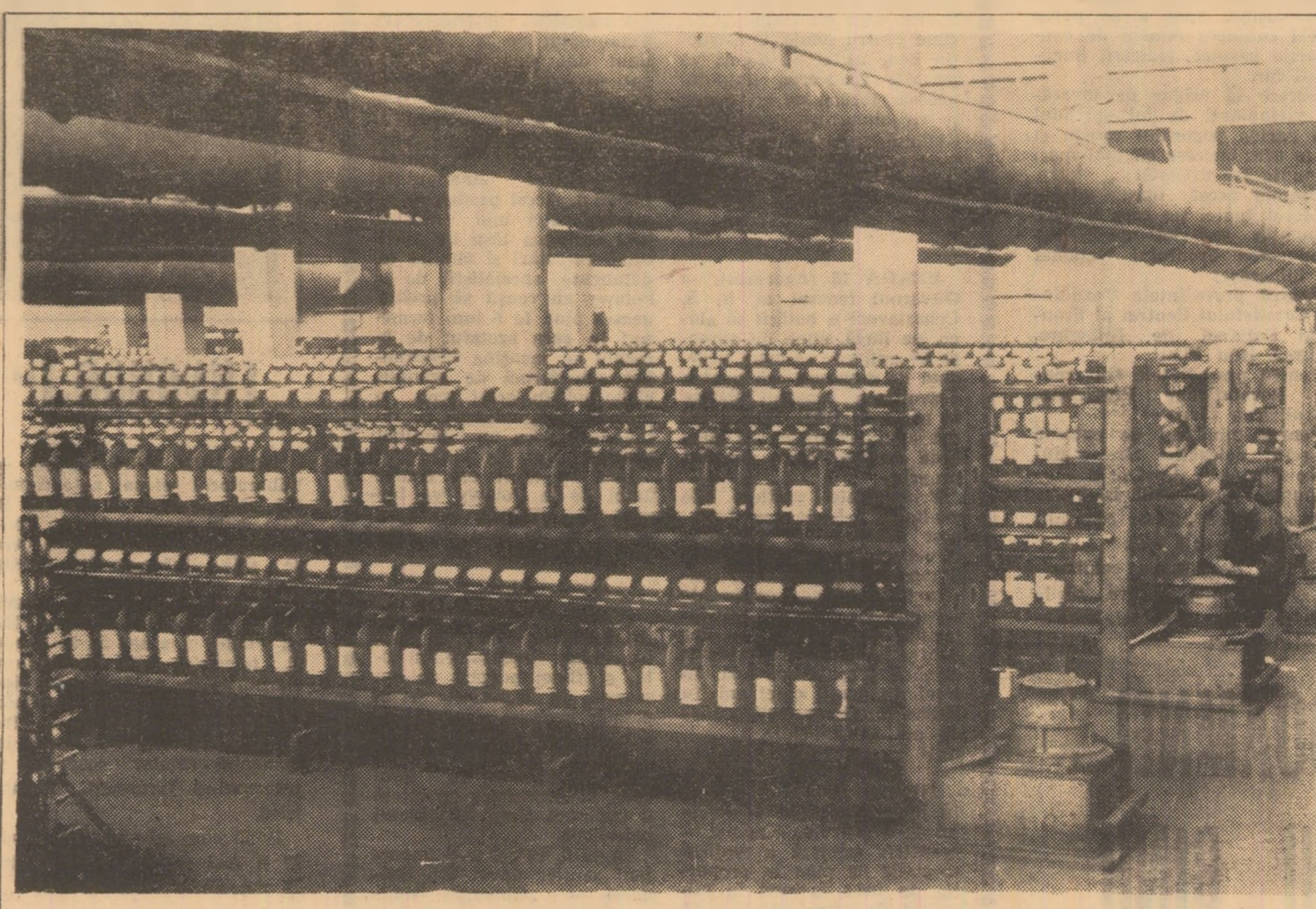
„Viscoza” Lupeni: Vedere din secția a III-a răsucit