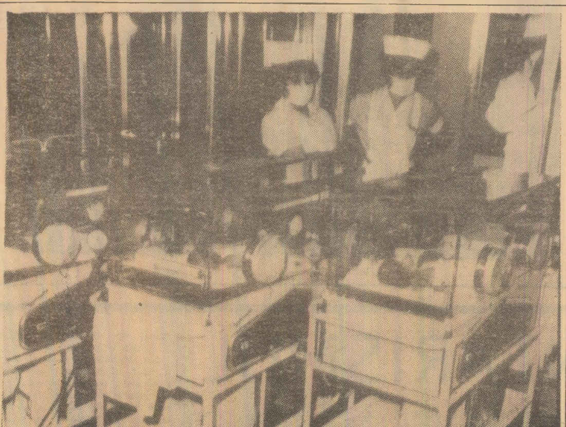
R.S.F. IUGOSLAVIA: La spitalul „Kosevo” din Sarajevo s-au născut 4 băieți gemeni care cântăresc împreună 7.100 grame. În foto: Cei 4 gemeni, aflați sub supraveghere specială.