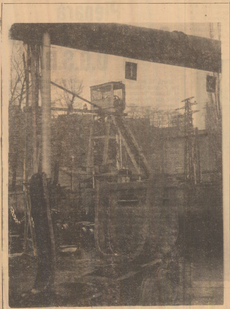
Un crîmpaci din circuitul de transport „de la ziua” al mîinii Lupeni.

rința de a asigura condiții cât mai bune fabricării respectivei produse noi în nomenclatură uzinei — și care vor contribui în mod substanțial la întregirea profilului ei — colectivul întreprinderii și harnic al U.U.M.P. a prevăzut realizarea unui atelier menit efectuării diverselor lucrări de autmatizate. Atelierul se află în plină fază de amenajare.