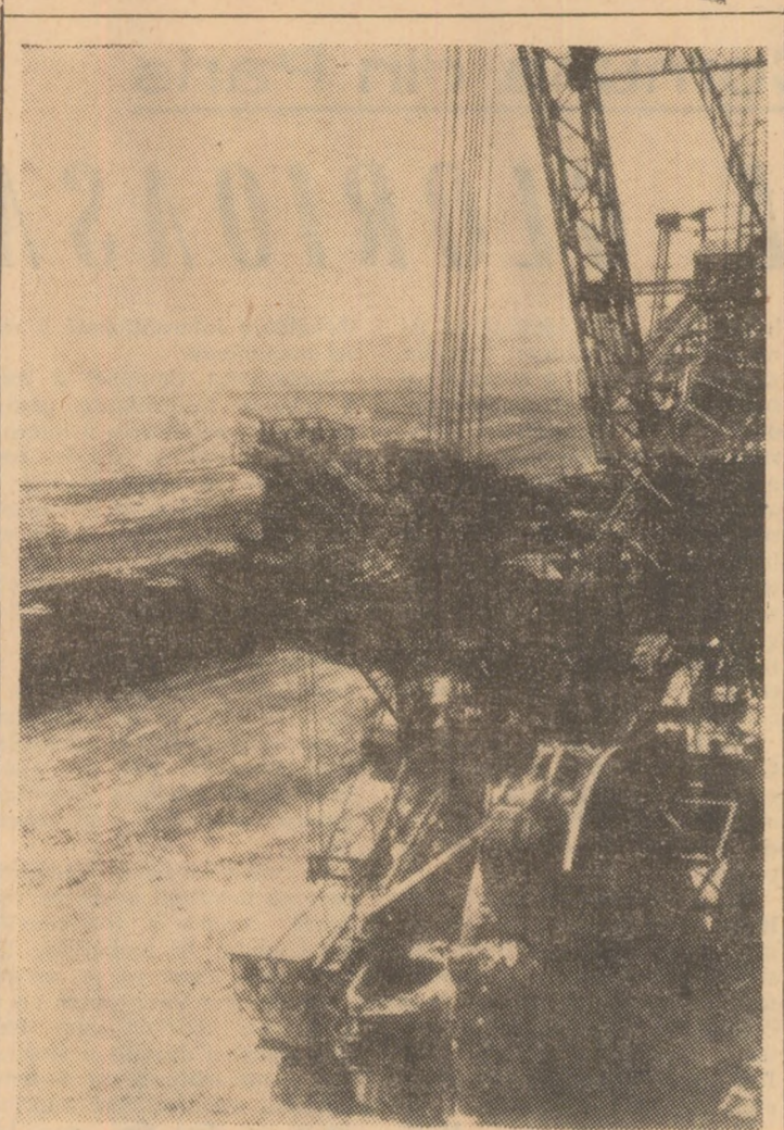
Exploatarea miniera de suprafață din bazinul carbonifer Maritza, în partea de sud-est a Bulgariei. În anii următori, producția de cărbune a Bulgariei va crește la 50 milioane tone pe an.

● În prezența lui Piotr Jaroszewicz, membru al Biroului Politic al C.C. al P.M.U.P., președintele Consiliului de Miniștri al R. P. Polone, și a altor persoane oficiale, la Zyduwo, în voievodatul Koszalin, a fost dată în funcțiune o nouă hidro-