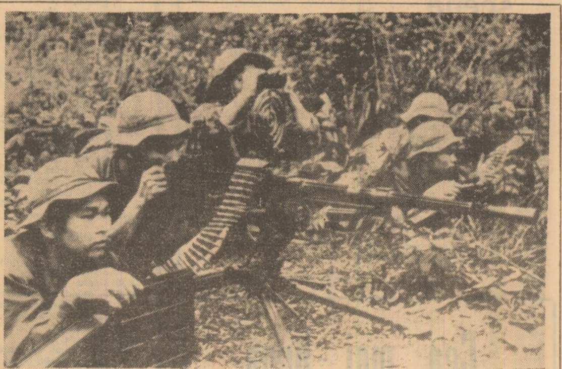
Unități ale forțelor patriotice din Vietnamul de sud continuă să atace bazele militare americane din regiunea Quang Tri, provocând grele pierderi inamicului. Operațiunile s-au axat în special asupra bazei americane de la Khe Sanh, care sprijină operațiunile trupelor saigoneze în Laos.

Relevind utilitatea consultărilor între ministerele afacerilor externe ale celor două țări și între reprezentanții celor două țări la O.N.U., în Comitetul de dezarmare și în alte organisme internaționale, cei doi miniștri au fost de acord cu extinderea lor în continuare. Ministrul afacerilor externe Corneliu Mănescu a încheiat primului ministru și ministrul afacerilor externe al Suediei, din partea guvernului român, invitația de a face o vizită oficială în România. Invitația a fost acceptată cu plăcere.