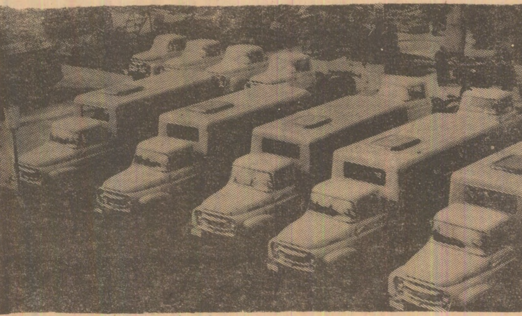
Un lot de autobuze, gata de a fi livrate exploataților miniere, realizate la U. M. Timișoara