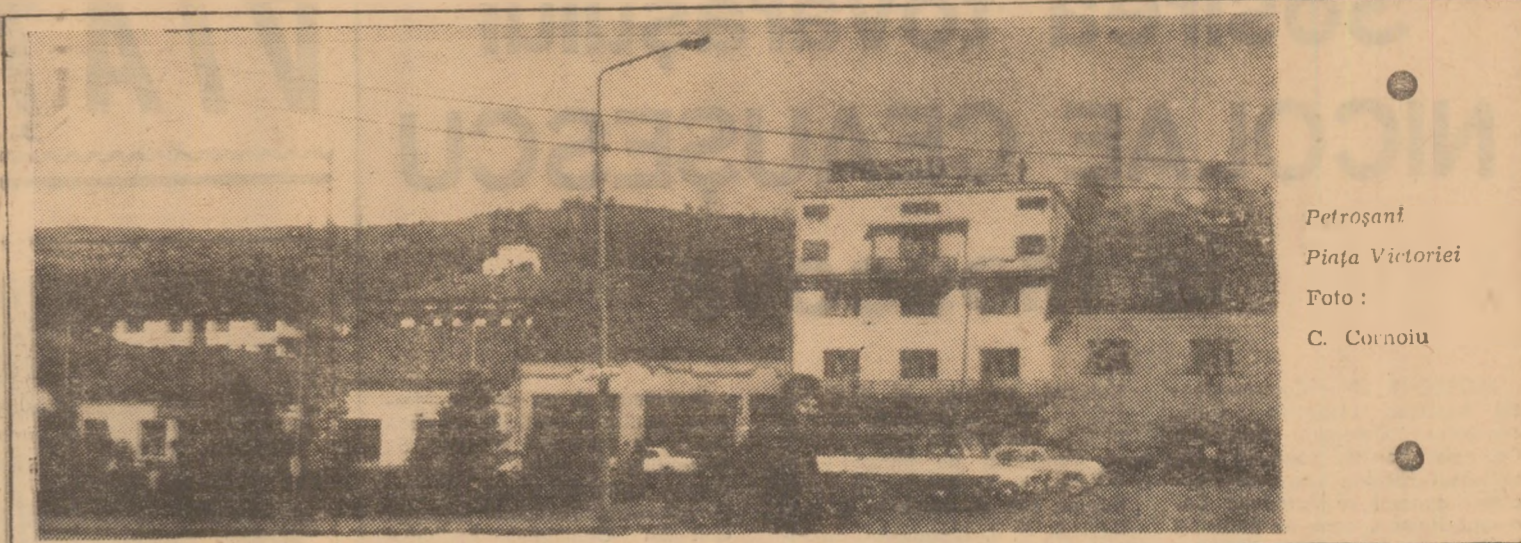
Petroșani Piața Victoriei