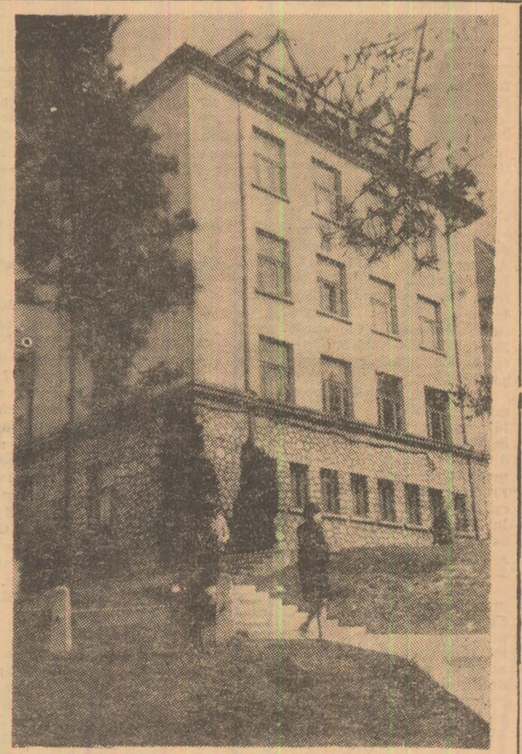
Sub soarele primăverii...