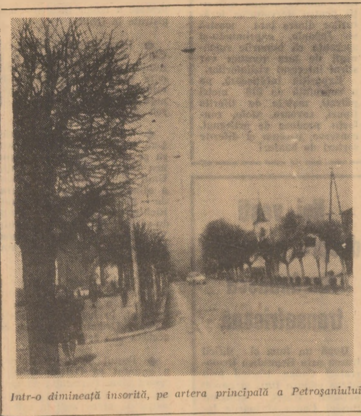
Intr-o dimineață însorită, pe artera principală a Petroșaniului