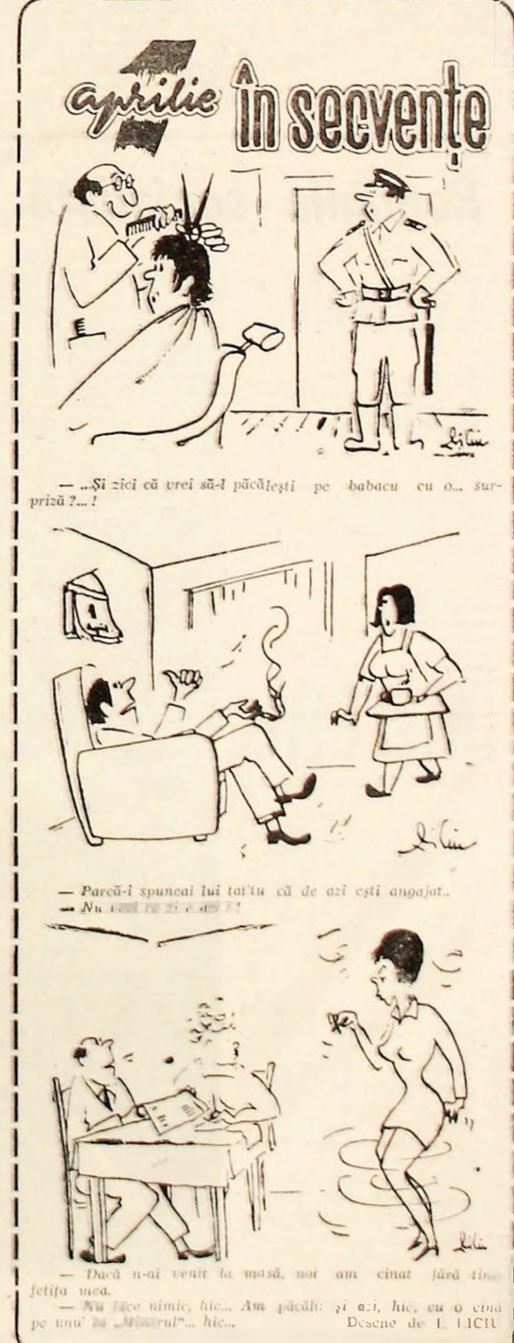
— Si zici că trezi să-i pîcăleşti pe babacu cu o surpriză?... — Parcă-i spunea lui tatăl că de azi ești angajat... — Nu face nimic, hie... Am plătit și azi, hie, cu o cină pe mine la „Mîntăru”, hie... — Dacă n-ai venit la mîntă, noi am cînat fără tine, fetița mea. — Nu face nimic, hie... Am plătit și azi, hie, cu o cină pe mine la „Mîntăru”, hie... — Dacă n-ai venit la mîntă, noi am cînat fără tine, fetița mea. — Nu face nimic, hie... Am plătit și azi, hie, cu o cină pe mine la „Mîntăru”, hie... — Dacă n-ai venit la mîntă, noi am cînat fără tine, fetița mea. — Nu face nimic, hie... Am plătit și azi, hie, cu o cină pe mine la „Mîntăru”, hie...