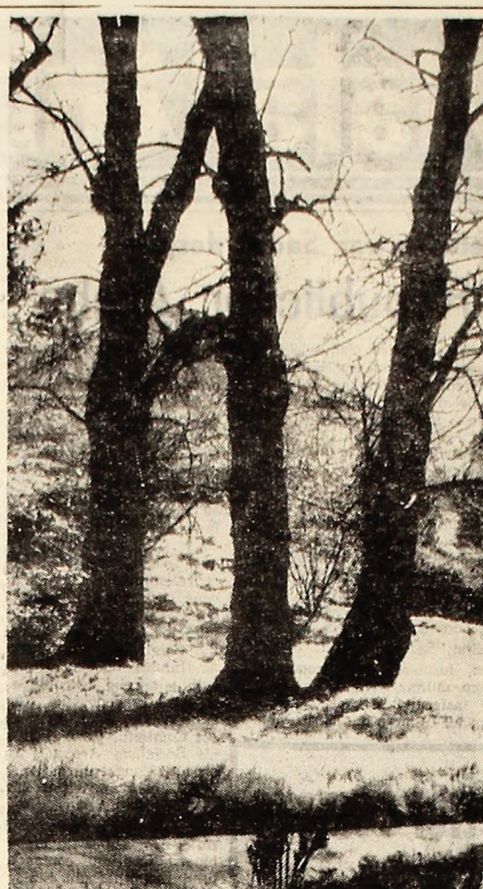
Inceput de primavară; Foto: V. ONOIU

succes. Minerii Văii Jiului au dat peste plan în aceste 3 luni 20.000 de tone de cărbune. Me- ritul să fie subliniat faptul că în acest an jubiliu, cînd uni- versăm semicentenarul Parti- dului Comunist Român, colecti- vele de mineri din bazinul nostru obțin cea mai ridicată indică tehnico-economică din cei peste 100 de ani de când se extrage cărbunele în acest- ta depresiune dintre Parîng și Relețaz.