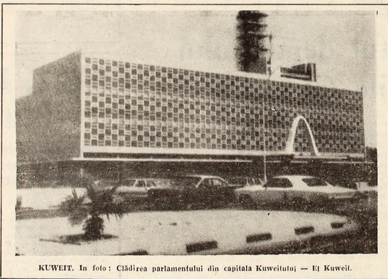
KUWEIT. În foto: Clădirea parlamentului din capitala Kuweitului — El Kuweit.

Sarcina cea mai urgentă a Indiei constă în lichidarea sărăciei și a bolilor de pe urma cărora suferă încă milioane de oameni”, a declarat în cadrul unui miting la Madras președintele Indiei, Venkata Giri. Rezolvarea cu succes a problemelor economice ale țării, a spus el, necesită unirea eforturilor întregului popor indian.