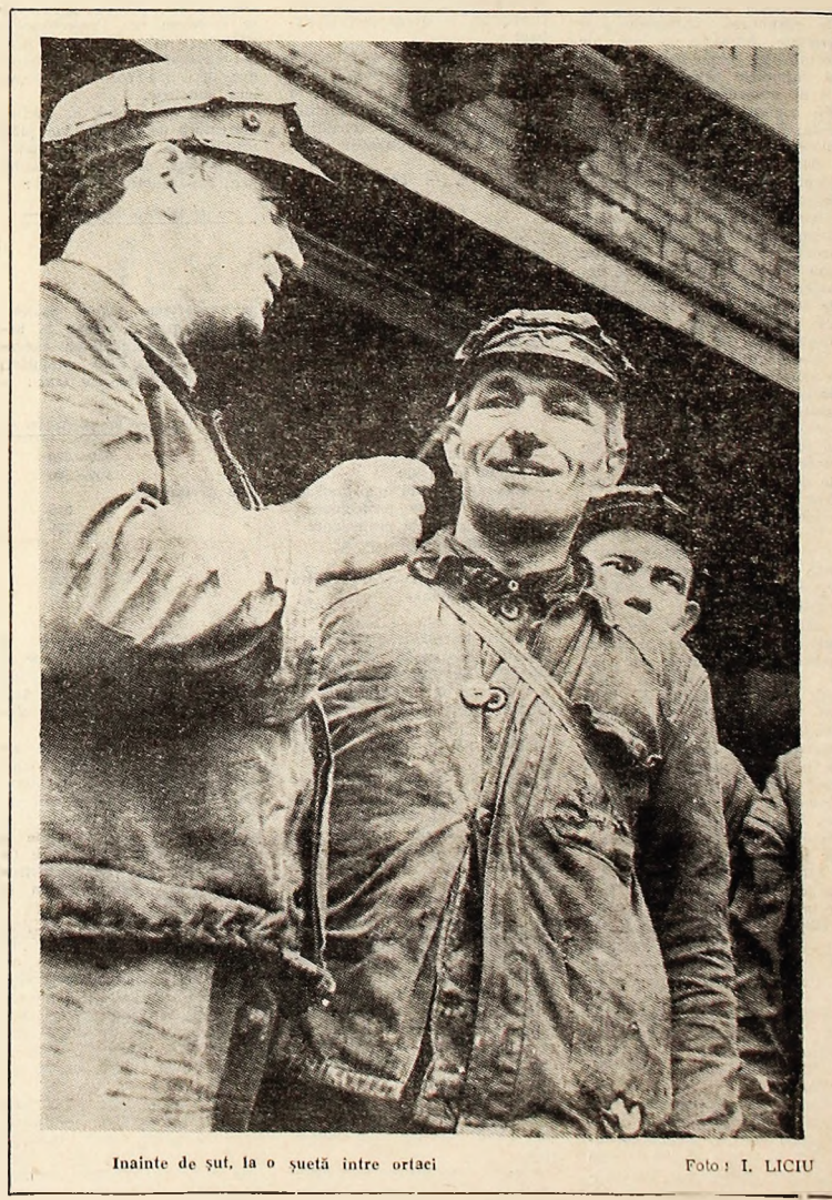
Înainte de șut, la o suetă între ortaci

Spectacolul muzical-coregrafic VÎRSTA DE AUR