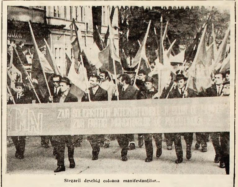
Stegarile deschid coloana manifestațiilor...