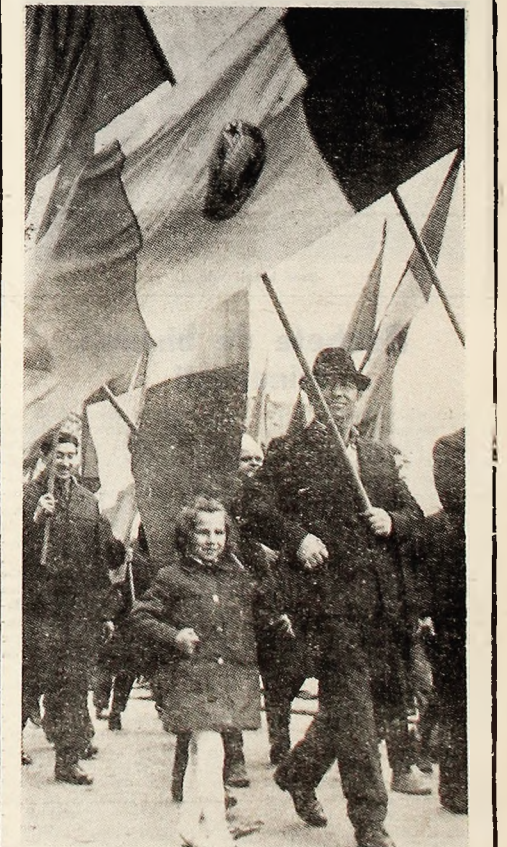
Sub faldurile tricolorului