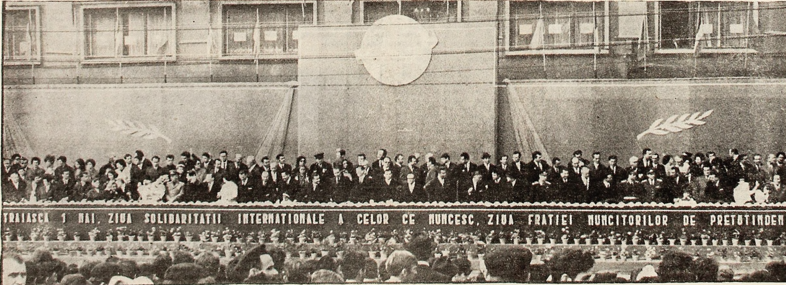
Tribuna oficială în timpul demonstrației oamenilor muncii din Valea Jiului