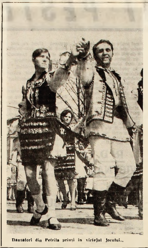
Dansatori din Petrița prinși în vîrtejul jocului...