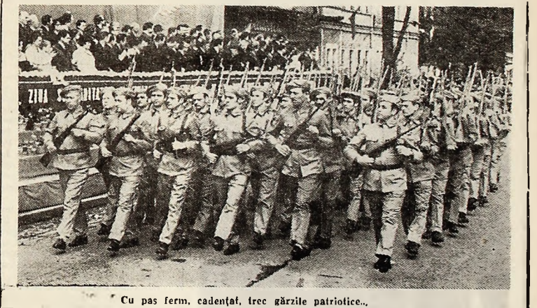
Cu pas ferm, cadențat, trec gările patriotice...