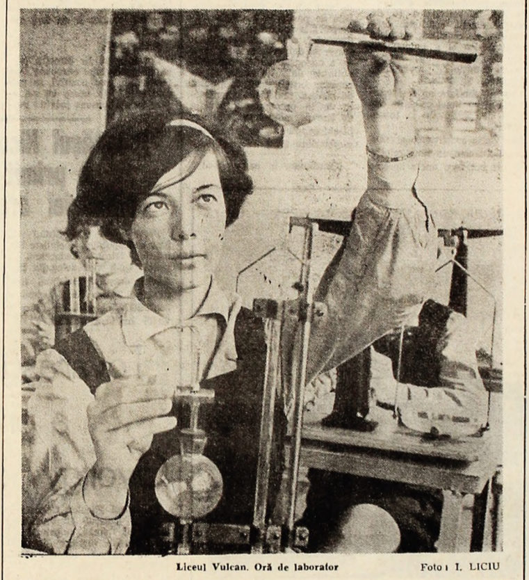
Liceul Vulcan. Oră de laborator.

Sîntem conștienți că pentru remedierea deficiențelor ce s-au manifestat și pentru lărgirea continuă a caracterului obșteșc în munca de partid este necesar ca biroul comitetului orașenesc de partid, secretariatul său, să imprime o răspundere și exigență sporită față de prevederile statutului P.C.R. și hotărîrile Plenei C.C. al P.C.R. din decembrie 1969 care se referă la acest domeniu, reușind în acest fel să atragă pe toți membrii de partid care fac parte din organele de conducere la o activitate operativă și să folosim mai organizat un număr mai mare de comunisti cu experiență și alte cadre de specialități în activitatea de partid.