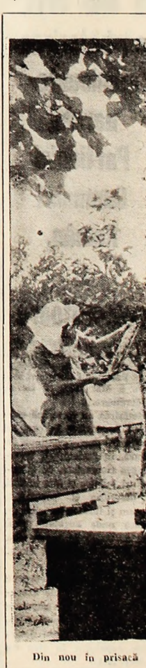
Din nou în prisacă

Începînd din 10 mai a. c. în fiecare luni, între orele 16-17 la Școala de muzică și arte plastice din Petroșani au loc cursuri de pregătire pentru preșcolarii în vederea admiterii în anele de învățămînt 1971-1972. Cursurile de pregătire vor avea loc în sediul școlii, strada Republicii nr. 110.