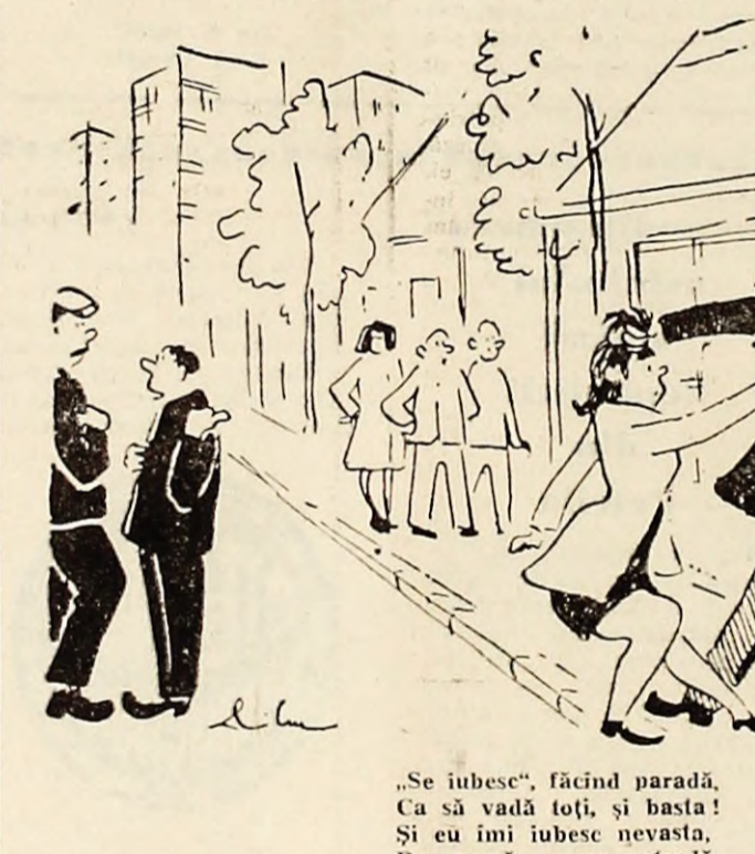
„Se iubesc”, făcînd paradă. Ca să vadă toți, și basta! Și eu îmi iubesc nevasta. Dar acasă, nu pe... stradă.

Într-una din serile trecute, cetățenii petrișeni au fost martorii unui spectacol în plină stradă principală. Un afront între doi soți, care se „păruiau” în mod public, administrativ și palme reciproce. Se zice că „fatalul” motiv ar fi fost faptul că soția ar fi răspuns la „salutul” adresat soțului de un alt bărbat, dar pe care acesta nu l-a „înțelept”.