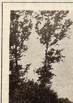
Amurg pe... Vălea Jiului

Vitorul strand al orașului reședință de municipiu, amplasat în cartierul Aeroport, se află într-un stadiu avansat de execuție. Pînă în prezent s-au turnat peste 290 metri cubi de beton, ceea ce reprezintă cea. 80 la sută din fundația strandului, s-au săpat 70 metri liniari canalizări, cu lucrările aferente, și două cămine de vizitare, au