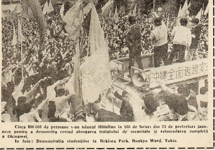
Circa 800.000 de persoane s-au adunat simulan în 160 de locuri din 23 de prefecturi japoneze pentru a demonstra cerind abrogarea tratatului de securitate și retrocedarea completă a Okinawei. In foto: Demonstrația studenților la Reikisen Park, Bunkyo Ward, Tokio.

rat o grevă generală în sprijinul retrocedării insulei către Japonia și împotriva tratamentului la care sînt supuși muncitorii și salariații japonezi care deservesc bazele și instalațiile militare americane amplasate pe insulă. Pe de altă parte, se anunță că 30.000 de muncitori, profesori și studenți au organizat în parcul central din Naha un miting de protest, iar alte 50.000 de persoane au manifestat în fața birourilor administrației civile americane din insulă, exprimîndu-și nemulțumirea față de unele prevederi ale acordului de retrocedare a Okinawei care ignoră revendicările populației.