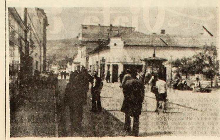
Pe strada mare

Dacă în alte locuri se mai poate invoca lipsa coriștilor, ce se poate însă invoca de către Institutul de muncă Petrosani care întodeuna a avut un cor puternic și care acum se mulțumește doar cu un grup vocal de muzică ușoară? Dar de Uzina de utilaj minier Petrosani unde ar exista, de asemenea, condiții pentru înființarea unui cor?