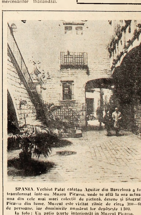
SPANIA. Vechiul Palat catalan Agular din Barcelona a fost transformat într-un Muzeu Picasso, unde se află la ora actuală una din cele mai mari colecții de pictură, desene și litografie Picasso din lume. Muzeul este vizitat zilnic de circa 300-600 de persoane, iar domeniile numărul lor depășește 1.500. În foto: Un patiu (curte interioară) în Muzeul Picasso.

venirea triumfală a lui Frei, apare neîndoielnic că Partidul Comunist din Chile a constituit centrul de propuneri și unificarea a stîngii într-o perioadă de timp îndelungată și frîntinată. Iar acum? Corvalan afirmă că adevărata victorie a politicii partidului constă în realizarea programului și în jarginea grupării de stînga. Pentru aceasta, partidul trebuie să fie exemplu de loialitate unitară și să știe să-și asume și cea mai dură responsabilitate. Este nevoie de un nivel ideologic și cultural mai înalt, de o prezentă organizatoare mai consistentă în fiecare fabrică, la școli și birouri. Și capacități tehnice, chiar dacă partidul nu trebuie să înlocuiască organele statului în conducerea societății. Și prospectivă unor idei împotriva oricărui schematism. În concordanță cu conștiința practică a valorii decisive a unității dintre socialiști și comu-