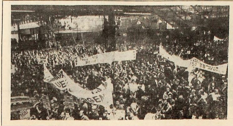
FRANȚA. Vedere din interiorul uzinelor „Renault” din Billancourt, ocupată de muncitorii greviști.

Lupte grele între forțele Frontului Național de Eliberare și efective militare americano-saigoneze au fost semnalate din nou în zona septentrională a Vietnamului de sud, în special în valea A Shau.