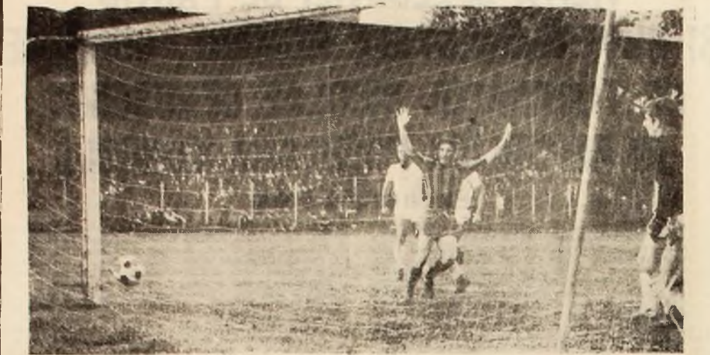
Al doilea gol: Libardi exultă. Balonul se odihnește în plasă. 2-0.