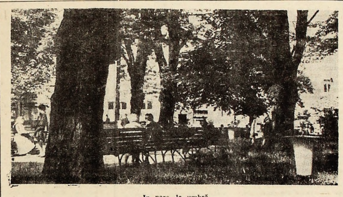
In parc, la umbră...

mlădie pline de primăvară... La amiaz, flori, cravate roșii, bluze albe, garafane, trandafiri, transformări. Cravate roșii, bluze albe, garafane, trandafiri, transformări. Cravate roșii, bluze albe, garafane, trandafiri, transformări. Cravate roșii, bluze albe, garafane, trandafiri, transformări.