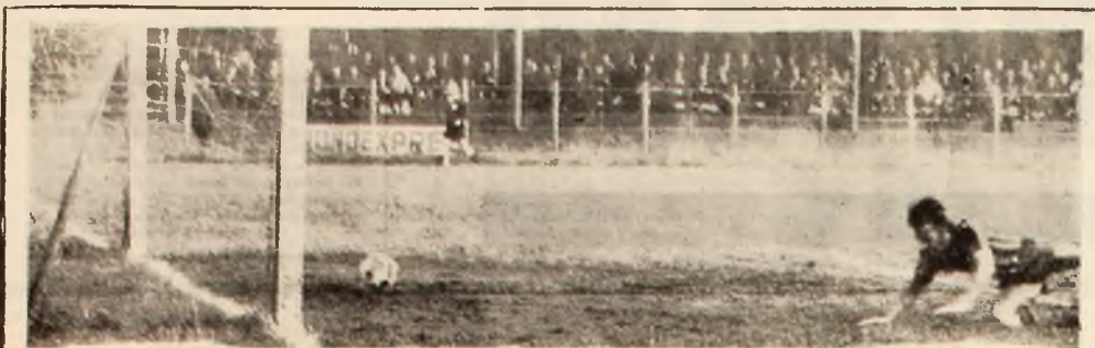
Prinul gol: Peronescu, din interiorul cercului mic, nu iartă. 1-0.