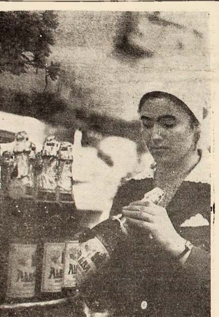
La „autoservirea” din Piața Victoriei — Petroșani solici-tudinea față de cumpărătorii se manifestă din plin...