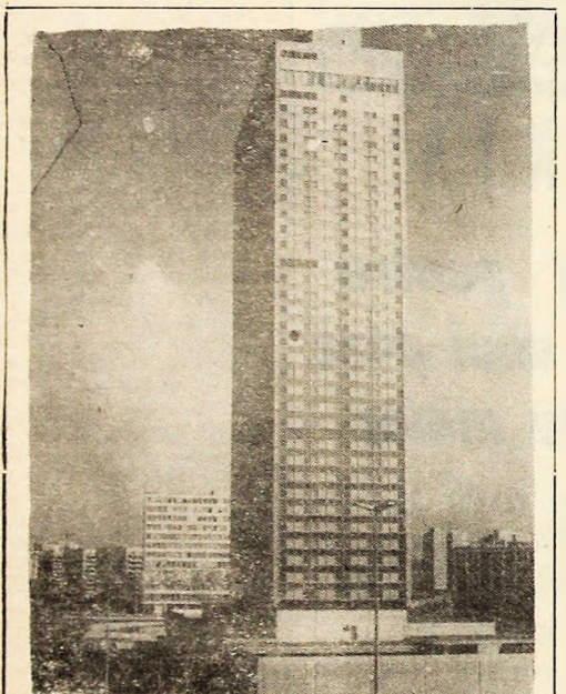
R. D. GERMANĂ: Vedere din Alexanderplatz — Berlin. Hotelul „Stadt Berlin”, cu 39 etaje.