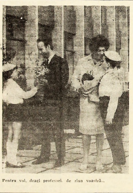
Pentru voi, dragi profesori, de ziua voastră...