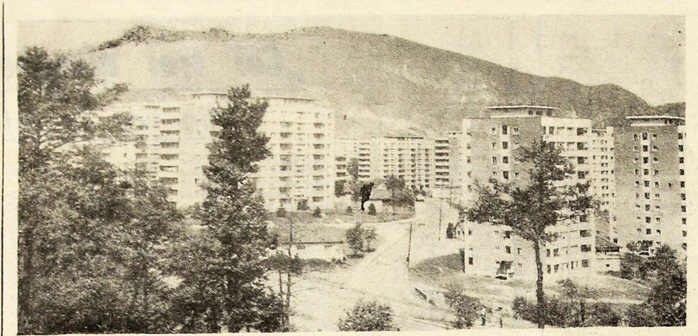
Ambianță arhitectonică din zilele noastre