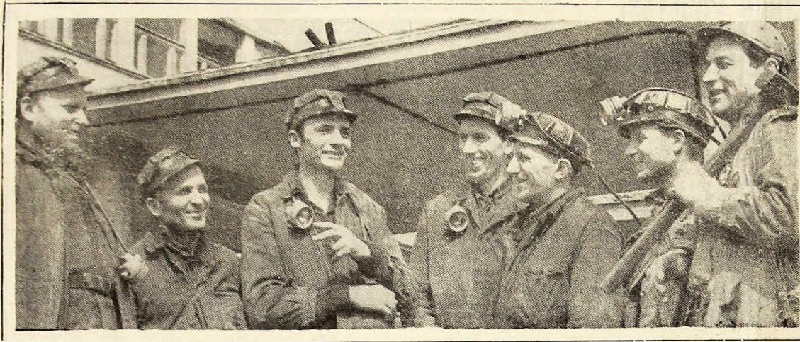
Zimbelul și voia bună au intrat in- toldeana în... spe- cificul minerilor vulcaneni.