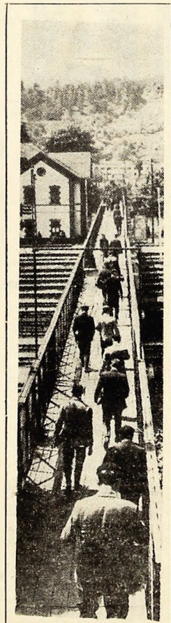
La întreprinderea de drumuri...