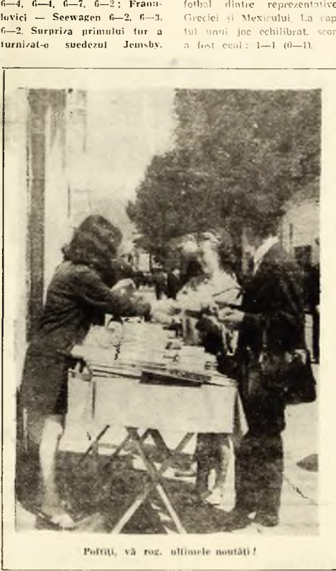
Poziții, vă rog, ultimele noutăți!