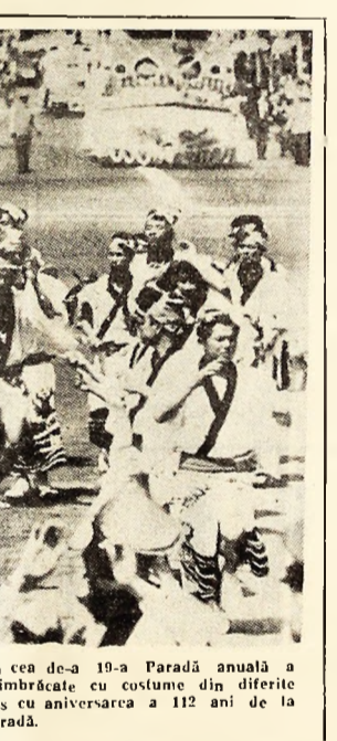
JAPONIA: Anul acesta s-a desfășurat la Yokohama cea de-a 19-a Paradă anuală a Măștilor, la care au participat peste 2000 de persoane, îmbrăcate cu costume din diferite epoci și regiuni ale țării. Parada de anul acesta a cinșcis cu aniversarea a 112 ani de la deschiderea portului Yokohama. În foto: Aspect de la paradă.

HELSINKI 7 (Agerpres) — În cursul vizitei pe care o întreprinde în Slovenia, președintele R.S.F. Iugoslavia, Iosip Broz Tito, a avut o întâlnire cu reprezentanții muncitorilor de la oțelăria din Ravne, vechi centru industrial al acestei republi-ci, relatând agenția Tanjug.