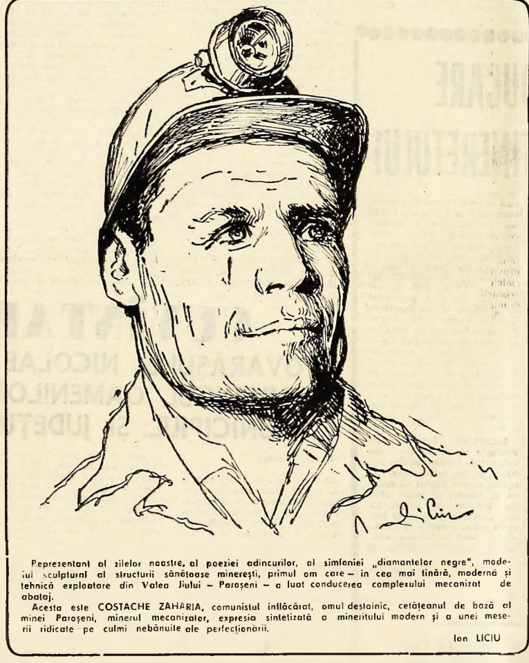
Prezentant al zilelor noastre, al poeziei edincurilor, al simfoniei „diamanților negri”, modelul sculptural al structurii sănătoase muncitorești, primul om care — în cea mai tânără, modernă și tehnică exploatare din Valea Jiului — Paroșeni — a luat conducerea complexului mecanizat de abație.

lor — adunați la sfârșit de fiecare lună — li s-au pregătit adevărate colecții etice; în fața formațiilor de lucru, a grupelor sindicale erau puși să explice de ce au lipsit de la ser-