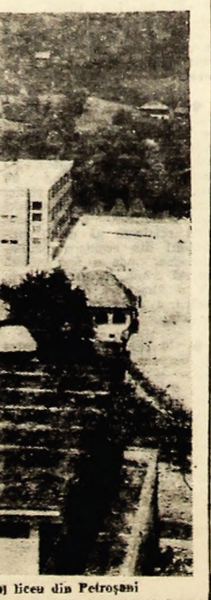
O vedere de sus spre noua liceu din Petrosani

VIND casă confortabilă și diverse lucruri; Peter Gроза 14, Petrosani.