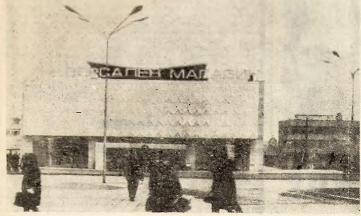
Un nou complex comercial din orașul Tolbuhin (R. P. Bulgaria).

La puțin timp de la încheierea „Conferinței de presă spațiale”, navea „Apollo-15” parcursese la ora 23.05 (ora Bucureștiului) jumătate din distanța ce-i mai rămăsese de străbătut până la Pământ — 197.300 km, apropiindu-se de acesta cu o viteză de 5.200 km pe oră.