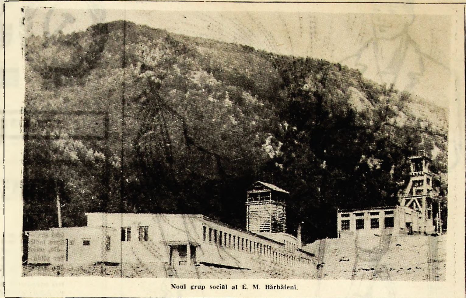
Noul grup social al E. M. Bărbănteni.