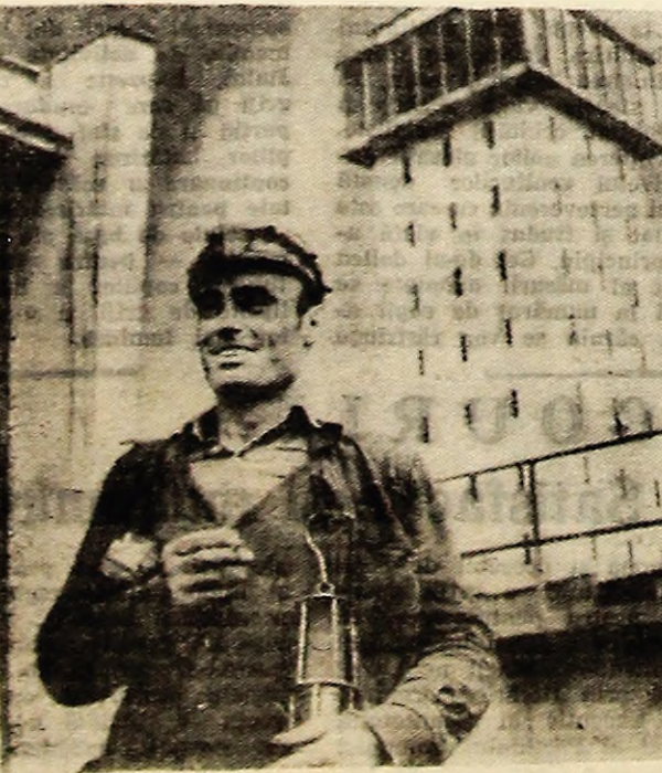
La rezultate bune, bună dispoziție.

„Avem deplina convingere că minerii patriei noastre vor ști să răspundă și în viitor, cu toată cinstea, stimei și prețuirii pe care le-o poartă partidul, că vor munci cu avînt și abnegație pentru a transpune în fapte sarcinile deosebit de importante ce le revin în cadrul economiei naționale, aducîndu-și contribuția tot mai activă la progresul general al României socialiste, la ridicarea ei pe culmile tot mai înalte ale civilizației, la bunăstarea întregului popor“.