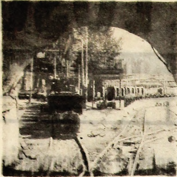
Între (jugal) în schimbul II la mina Lupeni.