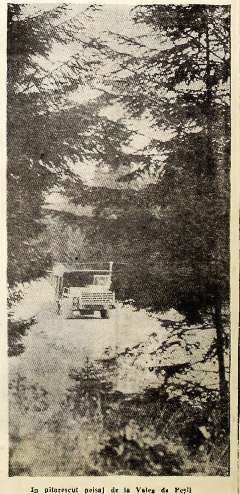
În pitorescul peisaj de la Valea de Peși