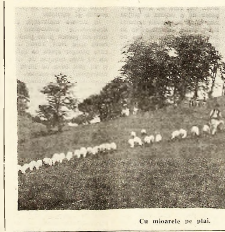
Cu mioarele pe plajă.