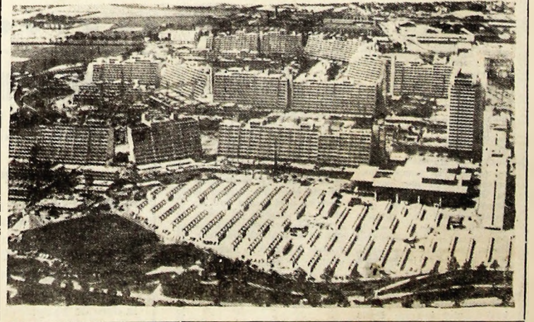
Pe foto: Vedere panoramică a Satului Olimpic, unde sportivii și sportivetele vor fi găzduți în frumosele blocuri ce se construiesc aici.