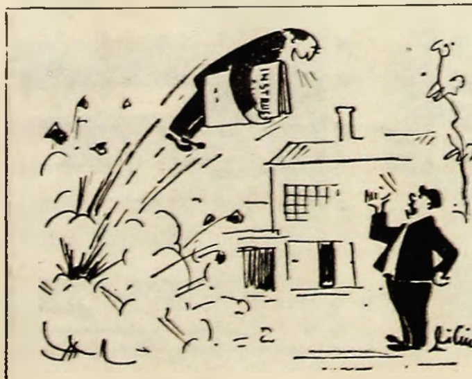
— Hei! Instrucțiunile, ce faci cu ele? — Dacă tot le-am luat țirziu, acum nu le mai las nici mort!