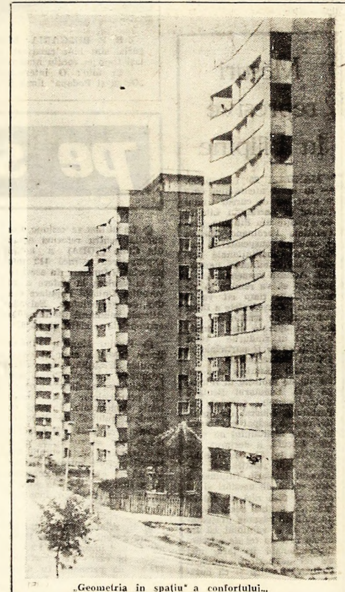
„Geometria în spațiu” a confortului...

16,15 Deschiderea emisiunii: Emisiune în limba germană; 18,00 Lînd seara, fete!; 18,15 Bună seara, băieți!; 19,15 Publicitate; 19,20 1001 de seri; 19,30 Teledjurnalul de seară; 20,00 Săptămîna internațională de Film-enciclopedie; 20,15 Film serial: Urmărirea — Episodul VII — Un joc cu păpuși; 22,00 Șlagăre și interpreti de pretutindeni; 22,45 Teledjurnalul de noapte; 22,55 Seară de romante; 23,10 Campionatele Balcanice de atletism și Campionatele Mondiale de lupte. Inregistrări de la Zagreb și Sofia.