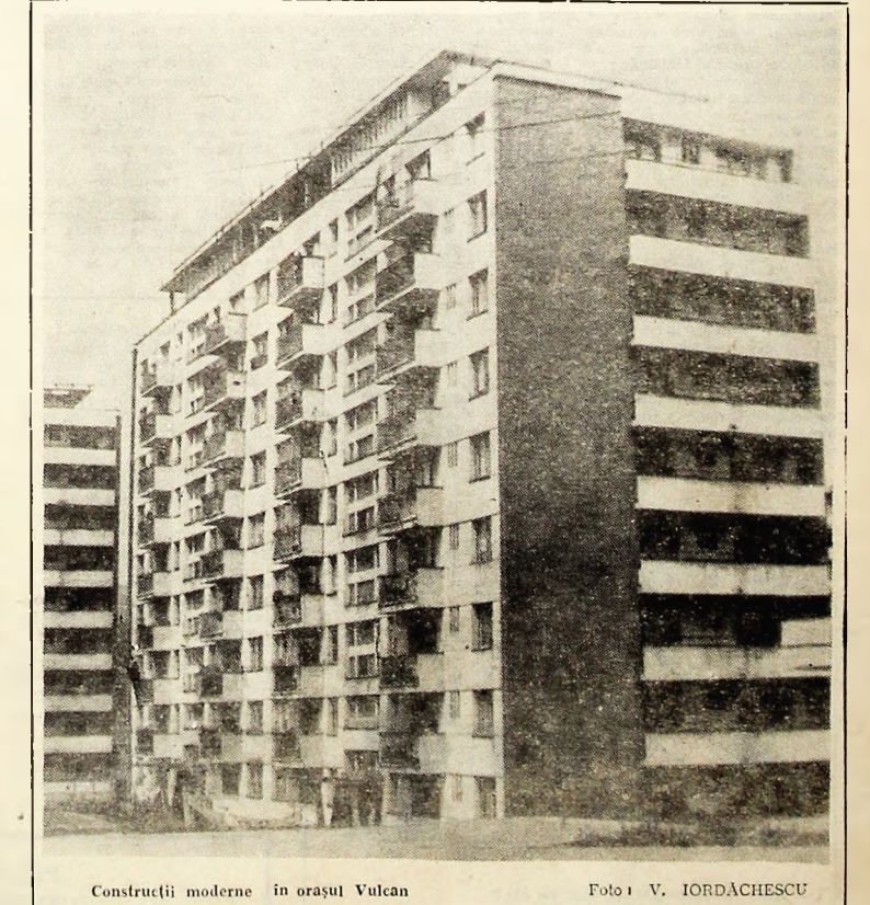
Construcții moderne în orașul Vulcan