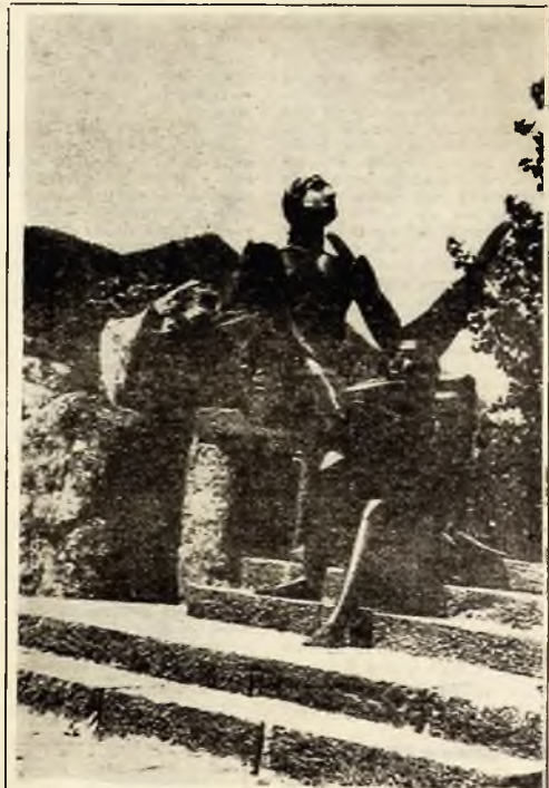
R. P. BULGARIA: Muzicii Rodopi din sud-vestul Bulgariei sînt bine cunoscuți pentru frumusețile lor...