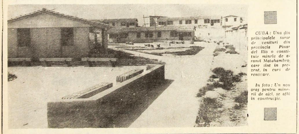
CUBA: Una din principalele surse de venituri din provincia Pinar del Rio o constituie minele de aur Matalembro care sînt în prezent în curs de renovare.

Pe de altă parte, informează corespondenții agențiilor de presă străine, unitățile patrioților au desfășurat acțiuni de luptă împotriva pozițiilor infanteriei saigoneze de la baza militară Fuller.