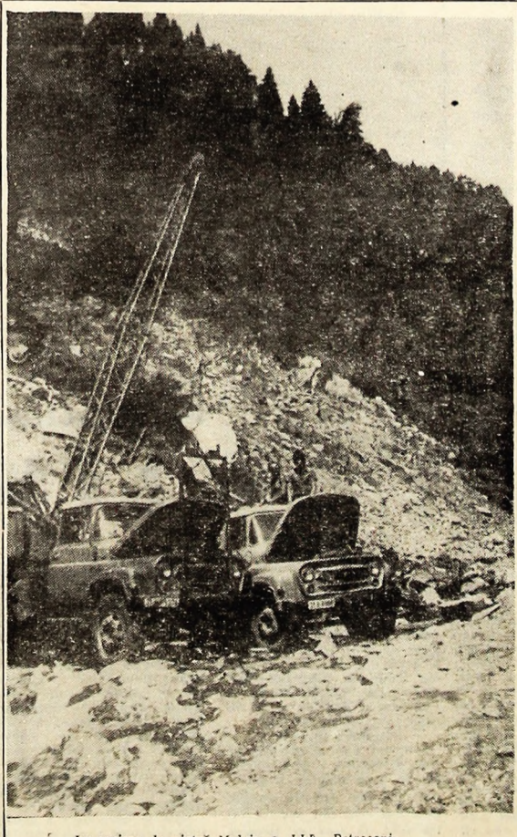
La cariera de piatră Mălea a I.L.B. Petroșani.