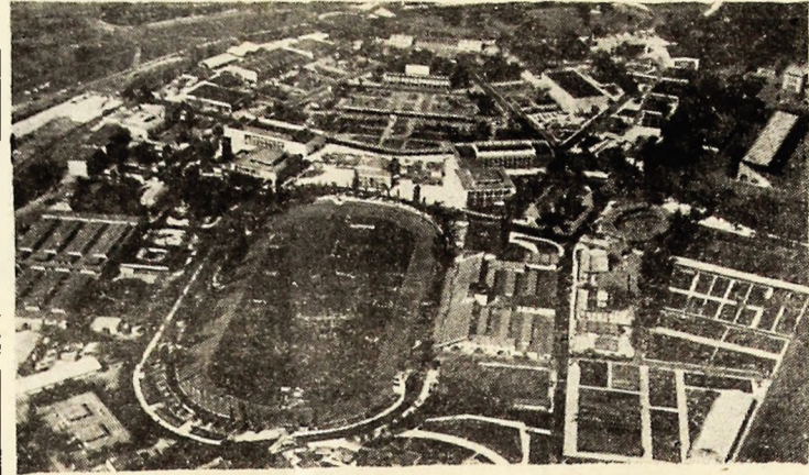
R. P. UNGARĂ: La 27 august s-a deschis la Budapesta Expoziția Internațională de Vinătoare la care participă aproape 50 de țări. Expoziția va fi deschisă până la 30 septembrie. În foto: Vedere aeriană a locului unde vor avea loc o serie de manifestări cu ocazia Expoziției.

GENEVA 27 (Agerpres). — În cursul lucrărilor Consiliului UNCTAD ce se desfășoară la Geneva, vorbind în numele grupului de țări africane, ambasadorul Republicii Malgase a cerut deschiderea negocierilor globale asupra produselor de bază în scopul remedierii deteriorării balanței de plăți a țărilor în curs de dezvoltare. El a relevat, de aceea, via precupărate a țărilor africane față de evoluția prețurilor produselor importate de țările africane, care au crescut sensibil în comparație cu prețurile produselor exportate de aceste țări care au scăzut. Potrivit părerii reprezentantului Republicii Malgase, în cadrul Conferinței Națiunilor Unite pentru Comerț și Dezvoltare, va trebui să fie făcută o analiză temeinică a prețurilor produselor africane de export în raport cu prețurile articolelor manufacturate importate și să se studieze posibilitățile creșterii volumului exporturilor țărilor în curs de dezvoltare. Totodată, a spus vorbitorul, este necesar să se încheie aranjamente financiare și tehnice pentru a se pune în aplicare prevederile hotărârii ale UNCTAD care să permită o diversificare orizontală și verticală a economiilor statelor africane.