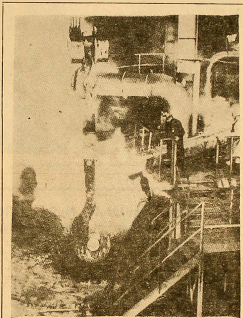
La chemarea Partidului Comunist Polonez, muncitorii metalurgiști de la Uzina metalurgică de prelucrare a cuprului „Glogow” din Zukowice s-au angajat să lucreze pe timp de noapte pentru a realiza un lot de 600 de tone de cupru purificat.

Consiliul G.A.T.T. a aprobat în unanimitate raportul grupului de lucru și protocolul de aderare. Conform practicii uzuale a G.A.T.T., în perioada următoare, protocolul de aderare este supus votului prin corespondență ai țărilor membre, urmînd a intra în vigoare la o lună după semnarea lui de către România.