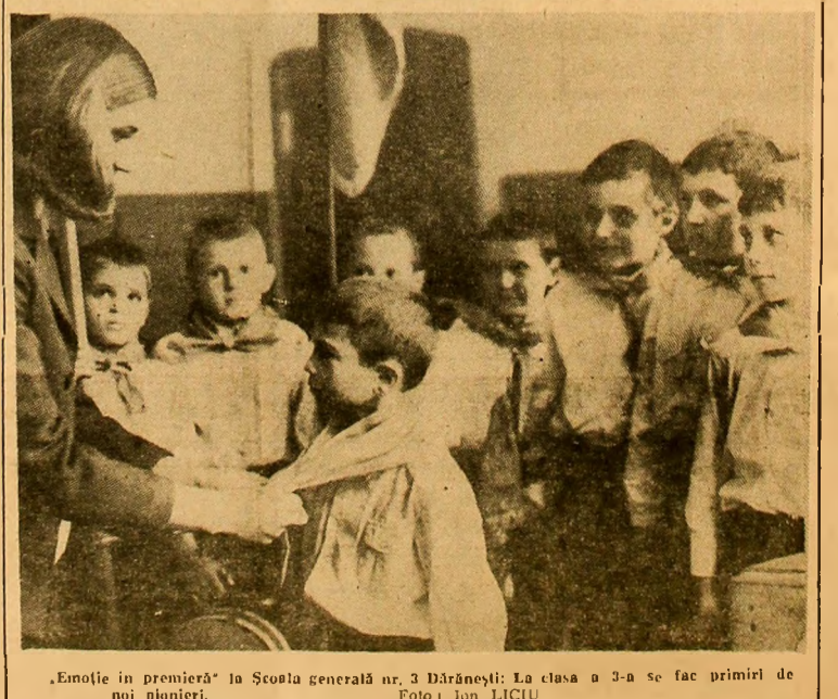
„Emoție în premieră” la Școala generală nr. 3 Dărănești. La clasa a 3-a se fac primul de noi pionieri.