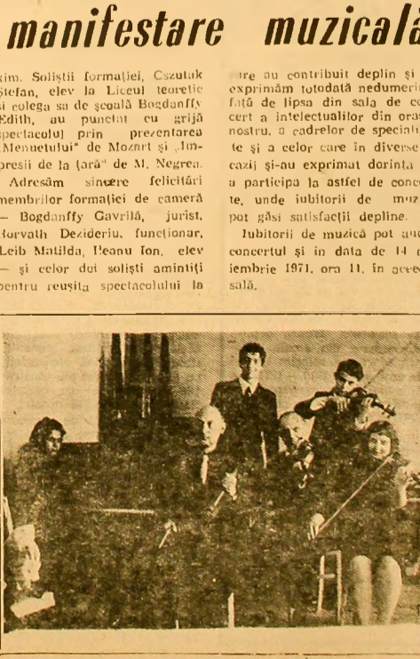
La una din repetițiile orchestrei de cameră

Duminică 31 octombrie a avut loc în sala mică a Casei de cultură, concertul orchestrei de cameră al acestei instituții. Rezultat al dragostei față de muzică, al unei pasiuni laudabile și al unei munci perseverente, concertul a constituit o reușită manifestare muzicală, prilejului publicului spectator momente de reală satisfacție artistică. „Mașul“ de Schubert, lucrare prin care formația și-a deschis concertul, chiar dacă nu face parte dintre cele mai semnificative compoziții schubertiene, s-a bucurat de o interpretare corectă și viguroasă vădînd în parte interpretul o înțelegere justă a partiturii. În cele două lucrări de Haydn „Romanța“ și „Cvartetul de coarde“, cit și în fragmentul din „Mica serenadă“ de Mozart s-a dovedit înaltă de partitură și în înțelegerea armonios cu sensibilitatea și echilibrul între compartimente. „Potpourri de dansuri românești“ al lui Martian Negrea a fost interpretat bine, tehnica individuală a instrumentiștilor fiind solicitată la maximum.