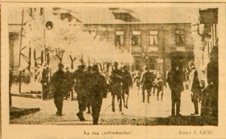
La ora „schimburilor”.