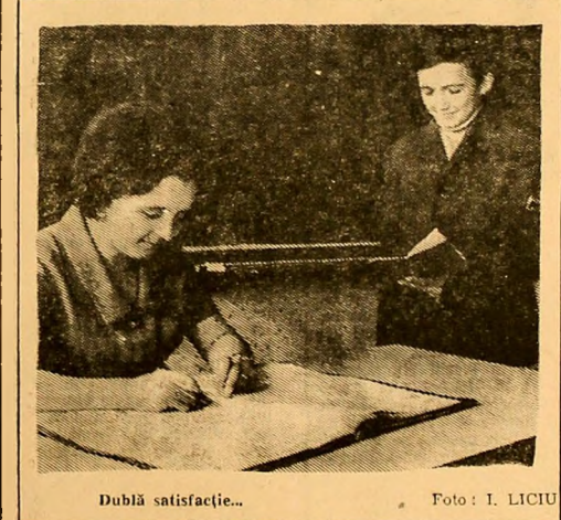
Dublă satisfacție...