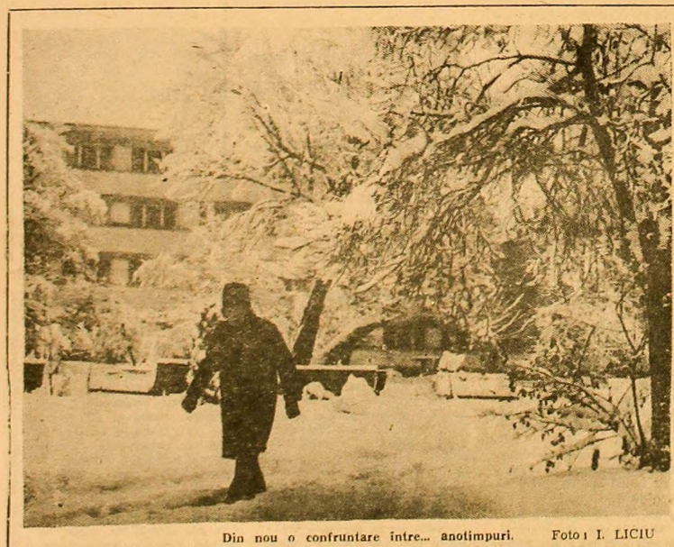
Din nou o confruntare între... anotimpuri.