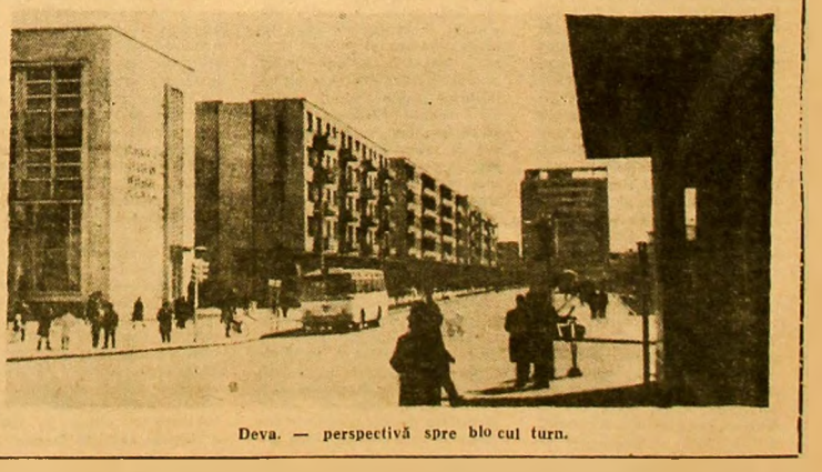
Deva — perspectivă spre blocul turn.