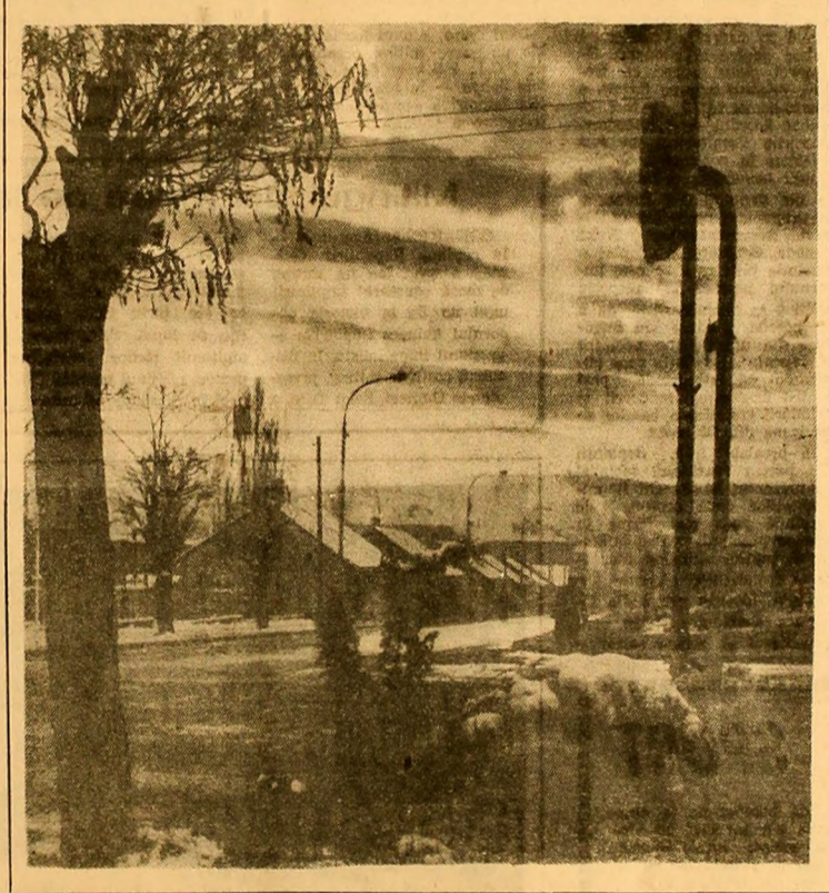
Amuz rec...