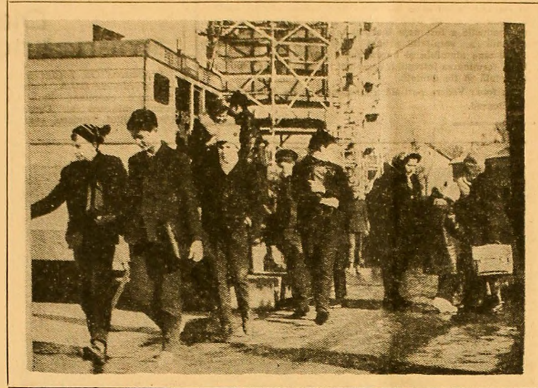
După o zi de școală...