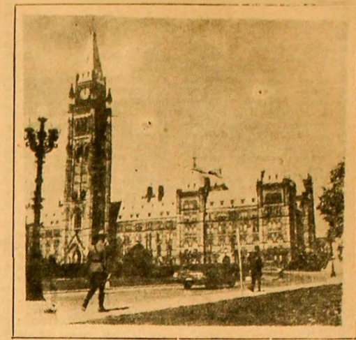
CANADA. În foto: Ottawa. Clădirea parlamentului federal.

...vizita delegației Partidului Comunist Român la Combinatul chimic de la Polawy