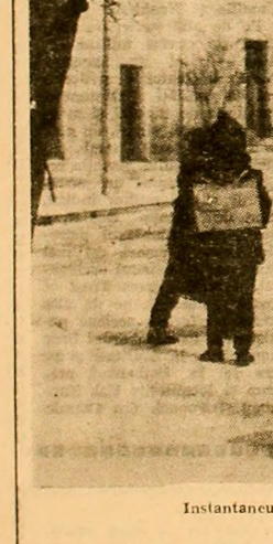
Instantaneu de... sezon.

„Am coborât în subteran, avînd întipărite în gînd cuvintele dominate de optimism ale șefului de brigadă D. Mitea... pare că totul merge mai bine acum cu schimb de opt ore. Ortașii mei, cel puțin, se mișcă mai vioi, parcă li s-a turnat argint viu în vine, au randament...”