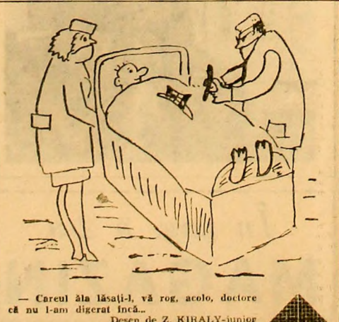
— Careul ala lăsați-l, vă rog, acolo, doctore că nu l-am digerat încă... Desen de Z. KIRALY-junior

s-o-ncurcat! — În orice privire!; 7) Insemnare; 8) Cu adevărul clar — Știnga (abr.); 9) Floare alba de boltă — Curelușă — Usturoi; 10) Nume vechi al unei țări asiatice — Știința de care ține și adevărul; 11) Abreviat — Scriitor german căruia i aparține cugărea: „Din păcate minciuna nu-și alege ca necheia numelui oameni necesități” — Fără nici o volorare; 12) Incontestabil adevăr — Conjuncție. Prof. I. IVANESCU Lupeni