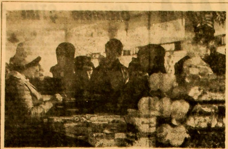
„Agglomeratie” la raionul dulciuri a complexului comercial Vulcan.