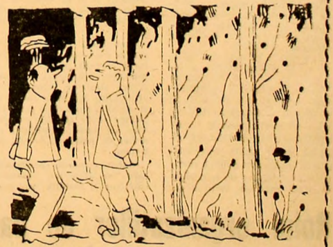
— Zici cu 70 de găuri Amorsate gata-ascăptă? — Cum vezi, însă de... trei schimburi Găurile stau să... bată!