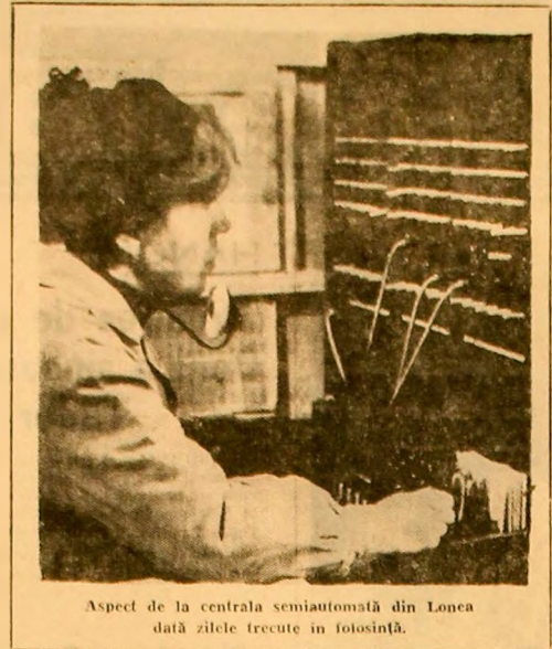
Aspect de la centrala semiautomată din Lonea dată zilele trecute in folosință.

— Abonabilii mai vechi, și în general populația, vor beneficia în mod grăbit de această centrală nouă. O problemă de interes este realizarea unei interconectări, care să conecteze, în cadrul Oficiului de poșta și telegrafii, cit și în populație, pe care va trebui să o rezolvăm in continuare o constituie realizarea numărului de abonati corespunzător capacității noi instalată. Pot să afirm că în ce ne privește pe noi, noua, avem posibilități materiale și forțe de muncă necesare pentru a onora solicitările. Avem deja un număr de cereri noi de instalare de te-