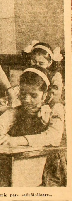
Lucrarea de control la istorie pare satisfăcătoare...

În fiecare zi, de câteva luni, elevii liceului din Petroșani, „Noviști” cum li se mai spune celor care locuiesc în Petroșani sau localitățile din jur, urcă în autobuzele locale la capăt de linie, bineînțeles ocupând și locul cuvenit. Deci, un fel de beneficiari de drept al școlii!