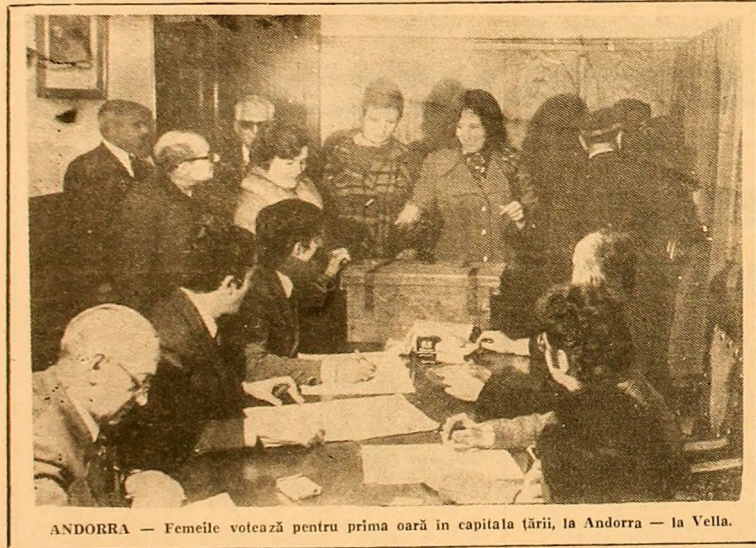
ANDORRA — Femeile votează pentru prima oară în capitala țării, la Andorra — la Vella.