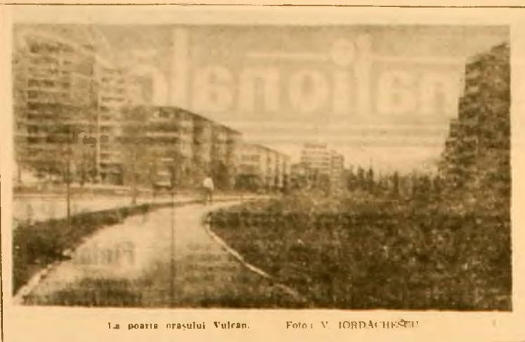
La poartă oraşului Vulcan.