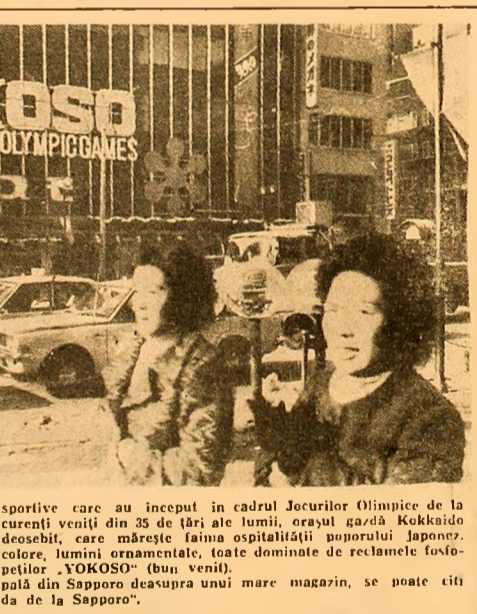
Cu prilejul întrecerilor sportive care au început în cadrul Jocurilor Olimpice de la Sapporo, la care participă concurenți veniți din 35 de țări ale lumii, garda Kikkaido a fost împodobit cu un fast deosebit.

PARIS 4 (Agerpres). — Potrivit relațiilor agențiilor occidentale de presă, aurlul a continuat și joi și fie cotat la prețuri ridicate, ajungând, la încheierea activității burselor, la nivelul de 48,75 dolari unca. Pe de altă parte, deși pe unele piețe dolarul a reușit să se redreseze într-o mică măsură datorită cumpărărilor masive, efectuate de unele bănci naționale vest-europene, la Paris nivelul său a rămas tot atât de scăzut ca și miercuri, iar la Tokio,