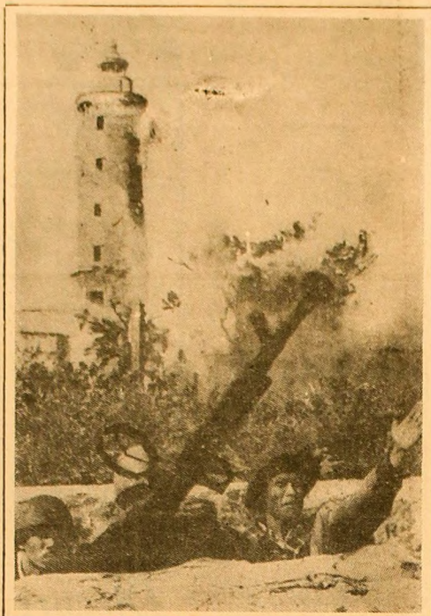
R.D. VIETNAM. Membrii echipei de apărare a forului din Hai Phong...