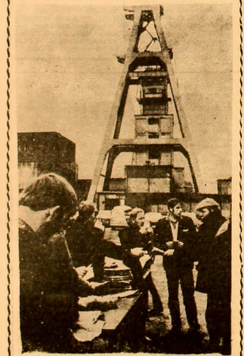
În Anglia, ca urmare a grevei generale a celor 280.000 de mineri, guvernul a hotărât să declare starea de urgență. După cum se știe, minerii organizați în pichete de grevă au oprit aprovizionarea unităților industriale cu cărbune...