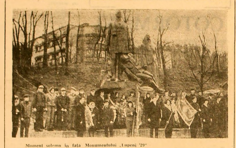
Moment solemn în fața Monumentului „Lupeni '29”

Duminică dimineața a avut loc, în orașul Lupeni, o amplă manifestare dedicată sărbătorii semicentenarului creării UTC — „Ștafeta generațiilor”. Această manifestare a prilejuit înținerirea a peste 5.000 de tineri mineri, constructori, energeticieni, elevi și studenți — români, maghiari, germani și de alte naționalități — de pe întreg cuprinsul Văii Jiului precum și din orașele Orăștie, Brad, Hunedoara, Simeria — cu vechi militanți ai mișcării revoluționare, comunisti din ilegalitate, foști uteciști în anii de grele încercări din trecutul glorios al patriei.