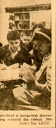
Casa de cultură Petroșani. Obiectivul a înregistrat duminică dimineață o constatare la masa rotundă din cadrul Studiului pionierilor.