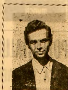
— Spune-mi, dacă-ți mai amintești, când ai auzit pentru prima dată cuvântul „fotbal”...