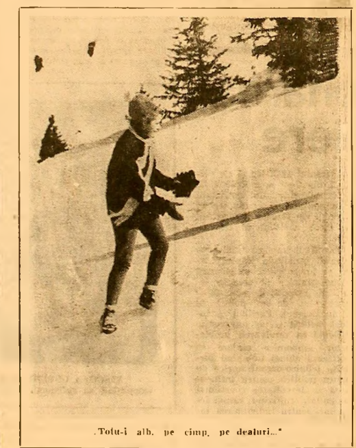
„Totu-i alb, pe cîmp, pe dealuri...”

„Fotbalul” — joc de bărbați? — Dacă cele două „advertismente” cu care s-a previne în prefața cititorilor („Aveți de-a face cu un document zguditor: cea mai serioasă și mai competentă cronică a fotbalului indigen și străin din ultimii ani...”)