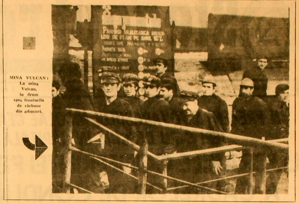
MINA VULCAN: La mina Vulcan, în drum spre fronturile de cărbune din adăncuri.