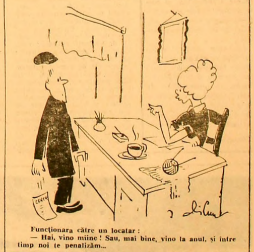
Funcționara către un locatar: — Hai, vino miine! Sau, mai bine, vino la anul, și între timp noi te penalizăm...

— De ce? Ați fost la ea acasă, cunoașteți cauza? — Nu știu. N-am fost. Eu sînt doar temporar învățătorul ei. Știu doar că mama ei stă cu cineva.