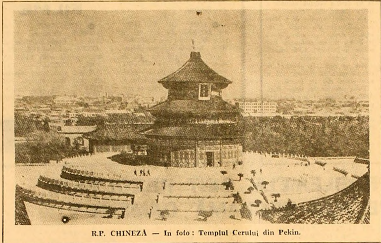
R.P. CHINEZĂ — În foto: Templul Cerului din Pekin.