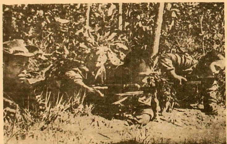
LAOS — Forțele patriotice din Laos au înregistrat numeroase victorii în lupta lor de eliberare a patriei...