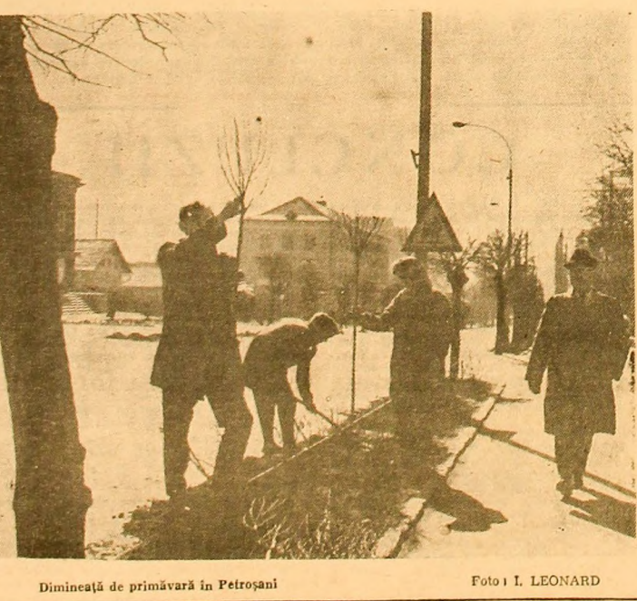
Dimineată de primăvară în Petroșani.

...ALB... — Mi-amintesc, scriam odăuă că Japtele umane au o existență mult mai de înaltă decît cea a ființelor înșirî. Să pornească de la această idee! Voi încerca. Cred că un greșesc. Japtele, hunele Japite omenesci — și cite vorbe frumoase se pot spune despre aceste Japite, cînd „subiecți” ai acțiunii își simt medicii — strălucesc, au o forță a lor launtrică, sprij care nu poți pricepe, au o înălțare a lor, pe care nu poți înțelege și nici nu poți să accepți. Da, imi vezi zice,