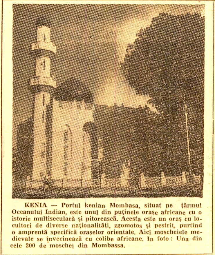
KENIA — Portul kenian Mombasa, situat pe țărmul Oceanului Indian, este unul din puținele orașe africane cu o istorie multeculară și pitorească. Acesta este un oraș cu locuitori de diverse naționalități, zgomotos și pestriț, purtînd o amprentă specifică orașelor orientale. Aici moscheile medievale se învecinează cu colibe africane. În foto: Una din cele 200 de moschei din Mombassa.

MOSCOVA 31 (Agerpres). — Agenția T.A.S.S. transmite că s-au încheiat cercetările privind cauzele și condițiile în care s-a petrecut, la 10 martie, accidentul în secția de carcase a Fabricii de radio din Minsk. După cum s-a mai anunțat, accidentul a cauzat victime umane. Comisia care a cercetat cauzele accidentului a stabilit că el s-a produs în urma unor greșeli comise la proiectarea sistemului de ventilare a secției, precum și neglijențelor în respectarea regulilor de tehnica securității în exploatarea acestui sistem.