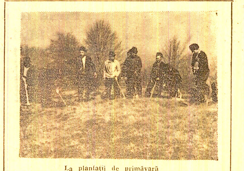
La plantații de primăvară