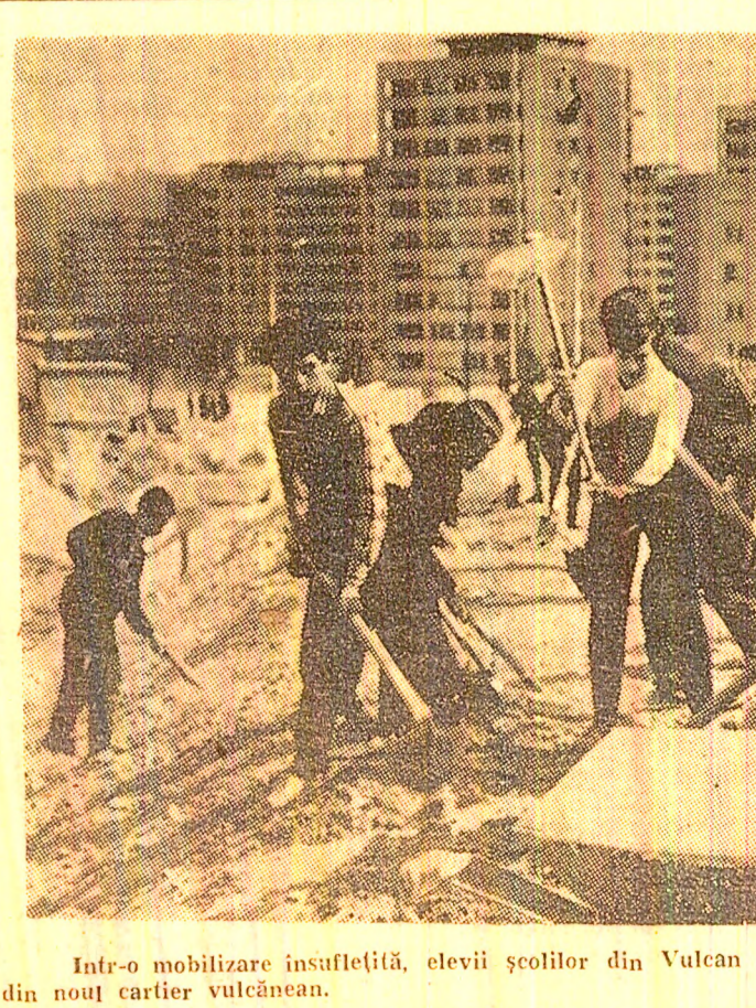
Intr-o mobilizare însuflețită, elevii școlilor din Vulcan „transformă” strada Viitorului din nou cartier vulcănean.